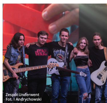
Zespół Underwent

Była to pierwsza taka impreza zorganizowana z inicjatywy młodzieży dla swoich rówieśników, tym samym Akademia Młodego Bemowiaka wkroczyła na nowy poziom. Po udanej premierze organizatorzy zapowiedzieli kolejną edycję Dnia Młodzieży na Bemowie.