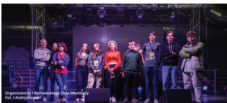
Organizatorzy I Bemowskiego Dnia Młodzieży