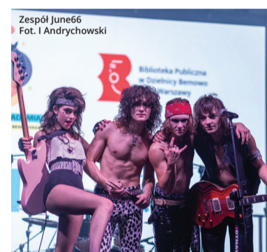
Zespół June66