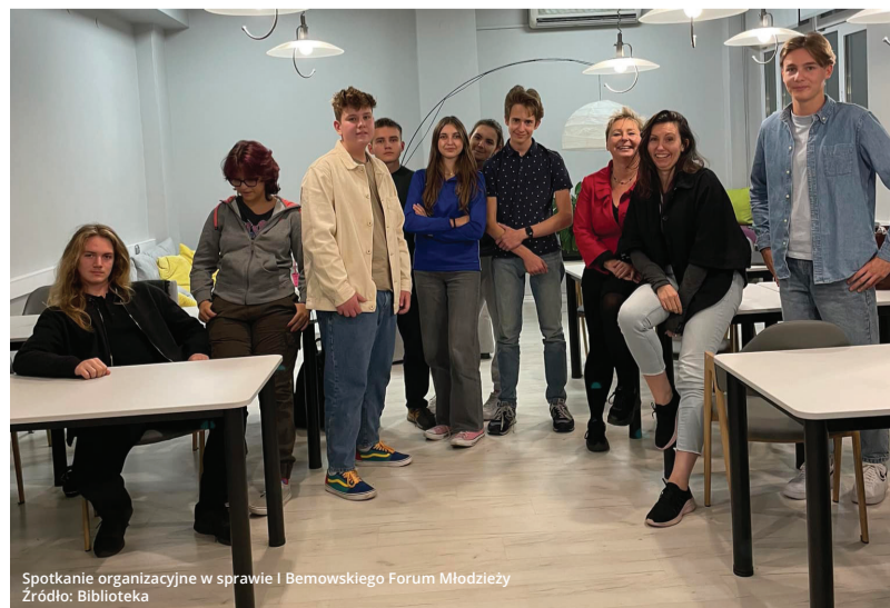
Spotkanie organizacyjne w sprawie I Bemowskiego Forum Młodzieży

I Bemowskie Forum Młodzieży będzie też idealną okazją do świętowania jubileuszu 5-lecia Młodzieżowej Rady Dzielnicy Bemowo oraz wyróżnienia osób, które w tym czasie wspierały Radę w jej działaniach.