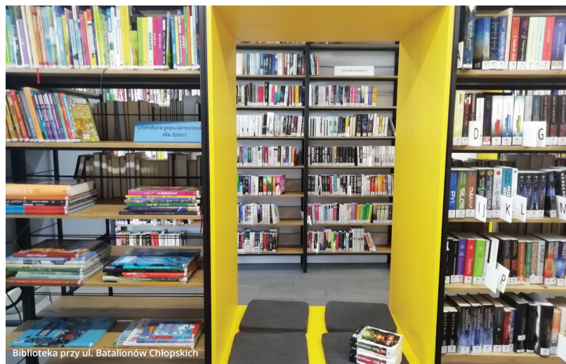
Biblioteka przy ul. Batalionów Chłopskich

W tym roku bemowska biblioteka włączyła się w akcję „Narodowego Czytania”, czytając wspólnie z mieszkańcami „Ballady i Romanse” podczas pikniku „Back to school”. Do czytania chętnie zgłaszali się uczestnicy pikniku. W akcję włączyli się też przedstawiciele bemowskiego samorządu i członkowie Młodzieżowej Rady Dzielnicy.