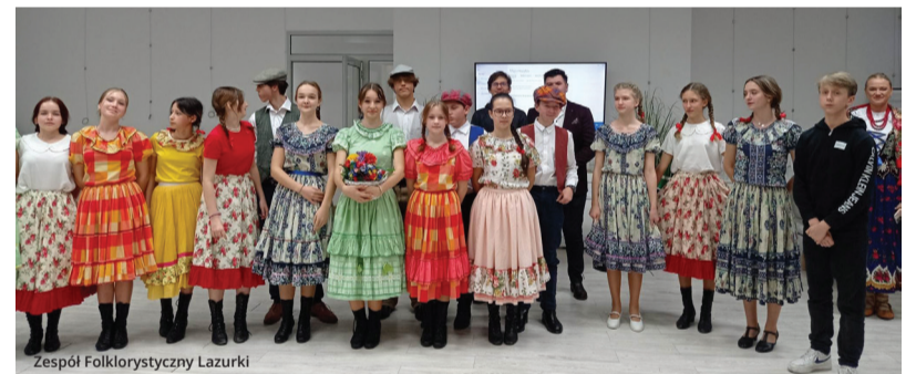
Zespół Folklorystyczny Lasurki

Celem akcji było nie tylko zachęcenie do zapisania się do biblioteki, ale również promocja wiedzy i postawy ekologicznej wśród czytelników. Każdy nowo zapisany czytelnik mógł otrzymać cebulki kwiatów. Trafiały one również do czytelnika, który wypożyczył materiały biblioteczne