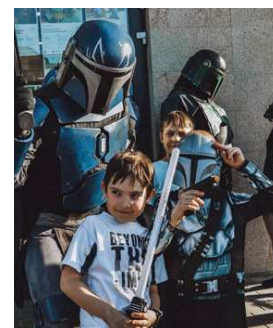
Dzień Gwiezdných Wojen w Wypożyczalni 141

Stowarzyszenie Bibliotekarzy Polskich doceniło i wyróżniło wydarzenia przygotowane przez bemowską bibliotekę w ramach Tygodnia Bibliotek 2024. To jedyna warszawska biblioteka, która została wyróżniona w konkursie.