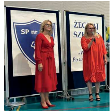
Zakończenie roku szkolnego - symboliczna kropka nad „I” w działaniach na rzecz edukacji

KO: Na ostatniej sesji udało się zatwierdzić zmiany w budżecie, które przewidują środki