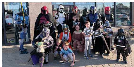
Dzień Gwiezdných Wojen w Wypożyczalni 141