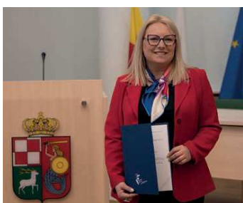
Oficjalne objęcie mandatu Radnej Dzielnicy Bemowo.

MnC: A bemowska społeczność jest otwarta na dialog? Zaangażowana w życie swojej dzielnicy? Można do tej aktywności jeszcze bardziej mobilizować?