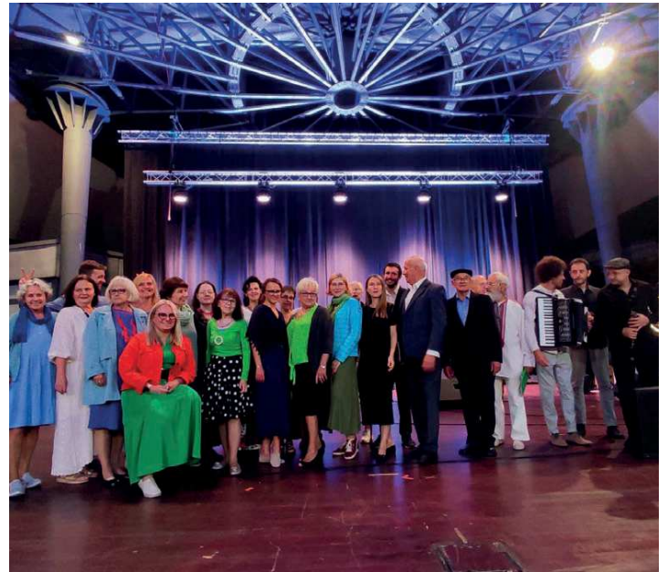
Promuje różne formy zaangażowania społecznego, w tym budżet obywatelski

KO: Tak, filozofia slow life jest mi bliska. Uważam, że w dzisiejszym szybkim tempie życia ważne jest, aby znaleźć czas na zwolnienie, refleksję i cieszenie się chwilą. Zorganizowanie targowiska z ekologiczną żywnością doskonale wpisuje się w tę filozofię. Promuje zdrowy tryb życia, wspiera lokalnych producentów i pozwala na bardziej świadome podejście do tego, co jemy. Takie targowisko nie tylko dostarczy zdrowych, naturalnych produktów, ale także stworzy przestrzeń do spotkań i bu-