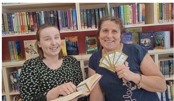
Tajemniczy bilety, cytaty i inne zabawy w Wypożyczalni 143